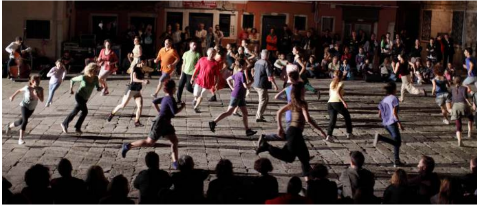
Foto 1: Virgilio Sieni, Agorà Tutti , Venezia, Campo San Maurizio, giugno 2013 © la Biennale di Venezia/Akiko Myiake.

marginale, un bordo dello spazio, che diventa ora il luogo di esperienza del suo poter “stare in mezzo”, tra il campo e la performance , e da cui sospendere (chissà, forse, anche ripensare) il suo incedere abituale, che altro non è che un’infinita “deviazione” per percorsi urbani stabiliti e prefissati dal flusso commerciale