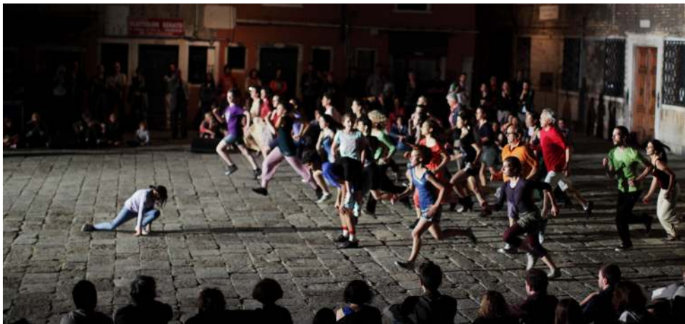
Foto 2: Virgilio Sieni, Agorà Tutti , Venezia, Campo San Maurizio, giugno 2013