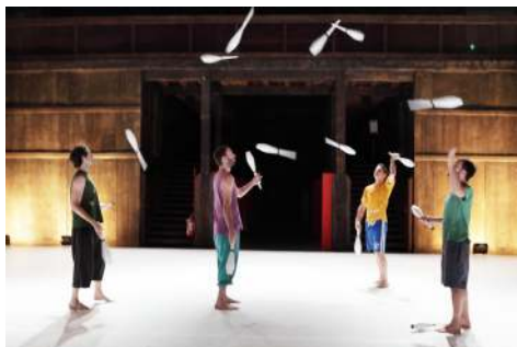
Foto 3: Alessandro Sciarroni, UNTITLED_I will be there when you die, Venezia, Tese dei Soppalchi, giugno 2013

per quattro giocolieri e la musica originale di Pablo Esbert Lilienfeld, Sciarroni dispone le presenze nello spazio secondo una griglia geometrica determinata già a prima vista dalla logica del danzare isolati . Qui la giocoleria non è il «prodotto funzionale di una istituzione»: Sciarroni abolisce il livello semantico della giocoleria (dimensione estetica) a favore soltanto del livello articolatorio (dimensione tecnica); essa non è giudicata «in base alla sua effettiva spettacolarità», ma in base alla sua affettiva loquacità 27 . Perché il codice, l'idioma è assunto qui come un affetto, non come un precetto; così come il grado di predicibilità delle successioni dei numeri dipende da tensione emotiva oltre che da coerenza formale.