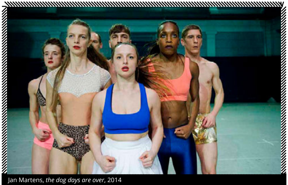
Jan Martens, the dog days are over , 2014

All'estetica della ripetizione appartengono di certo progetti come Turning di Alessandro Sciarroni o spettacoli come Dog Days are Over di Jan Martens: in entrambi, il concetto di ripetizione, assieme a quello di resistenza nel tempo, si fa tematico. Chroma , performance parte del progetto Turning è interamente incentrato sull'azione della rotazione: Sciarroni per cinquanta minuti di performance ruota sul proprio asse modificando solamente la posizione delle braccia. Gli otto performer di Dog Days Are Over dal primo all'ultimo minuto dello spettacolo saltano insieme, su due piedi costruendo una coreografia tanto semplice quanto coinvolgente che gradualmente, proprio per l'alto livello di concentrazione e fatica richiesto, costringe a far venir fuori le persone che solitamente si nascondono dietro al ruolo di danzatori.