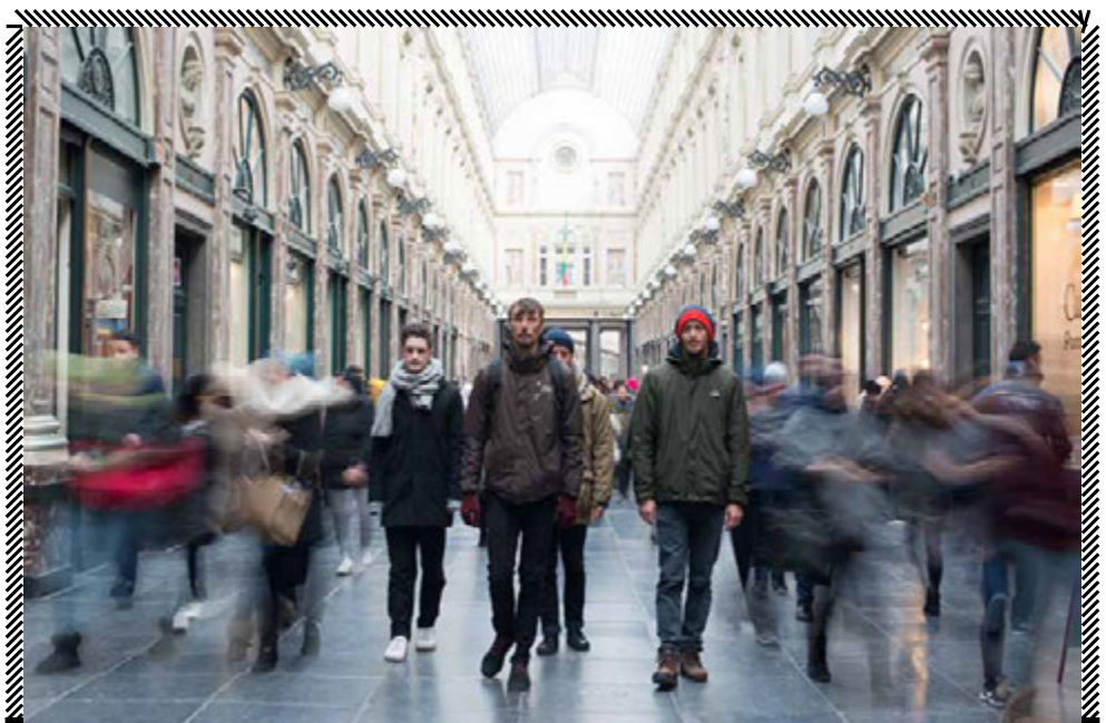
Anne Teresa de Keersmaeker, slow walk , 2016

Si trattava di gesti semplici il cui obiettivo era quello di occupare lo spazio pubblico attraverso il movimento condiviso dei partecipanti: muoversi velocemente da una parte all'altra della piazza; cercare di occupare tutti gli spazi vuoti nel minor tempo possibile; sedersi a terra tutti insieme, danzare liberamente. La Keersmaker, circa un mese prima, a pochi giorni di distanza dagli attentati di Bruxelles del 22 marzo, aveva lanciato una chiamata pubblica all'intera cittadinanza: si invitavano gli abitanti a ritrovarsi in strada, a riunirsi in piccoli gruppi e a muovere verso il centro camminando lentissimamente, occupando così lo spazio urbano con il tempo.