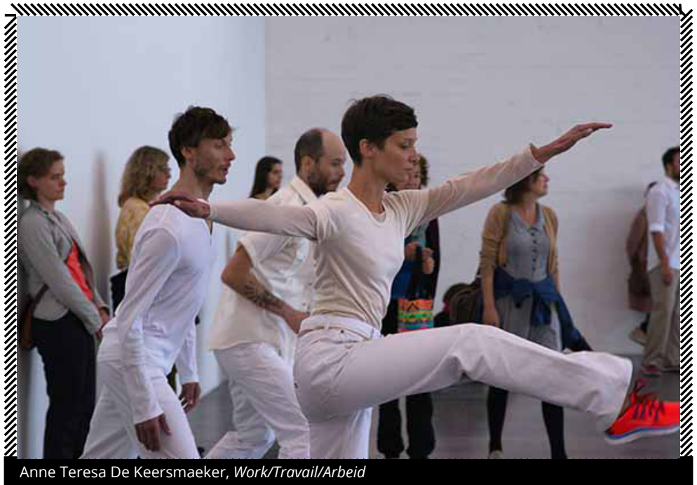
Anne Teresa De Keersmaeker, Work/Travail/Arbeid

seo si distinguono per le loro condizioni spaziali, temporali e percettive. Uno spettacolo di danza tratta del tempo e si costituisce come un'esperienza con una fine e un inizio definiti; una mostra, al contrario, raramente viene vissuta nell'integrità della sua durata. La riflessione su questa differenza deve aver spinto Anne Teresa de Keersmaeker a trasformare la coreografia di Vortex Temporum nel progetto Work/Travail/Arbeid che ripensa il suo spettacolo del 2013 nella forma di una mostra di nove settimane di durata (l'inaugurazione del progetto, poi replicato in altri musei nel mondo, andava dal 20 marzo al 17 maggio 2015) che occupava un intero piano del Wiels, il museo d'arte contemporanea di Bruxelles, continuamente accessibile al pubblico durante gli orari di apertura del museo.