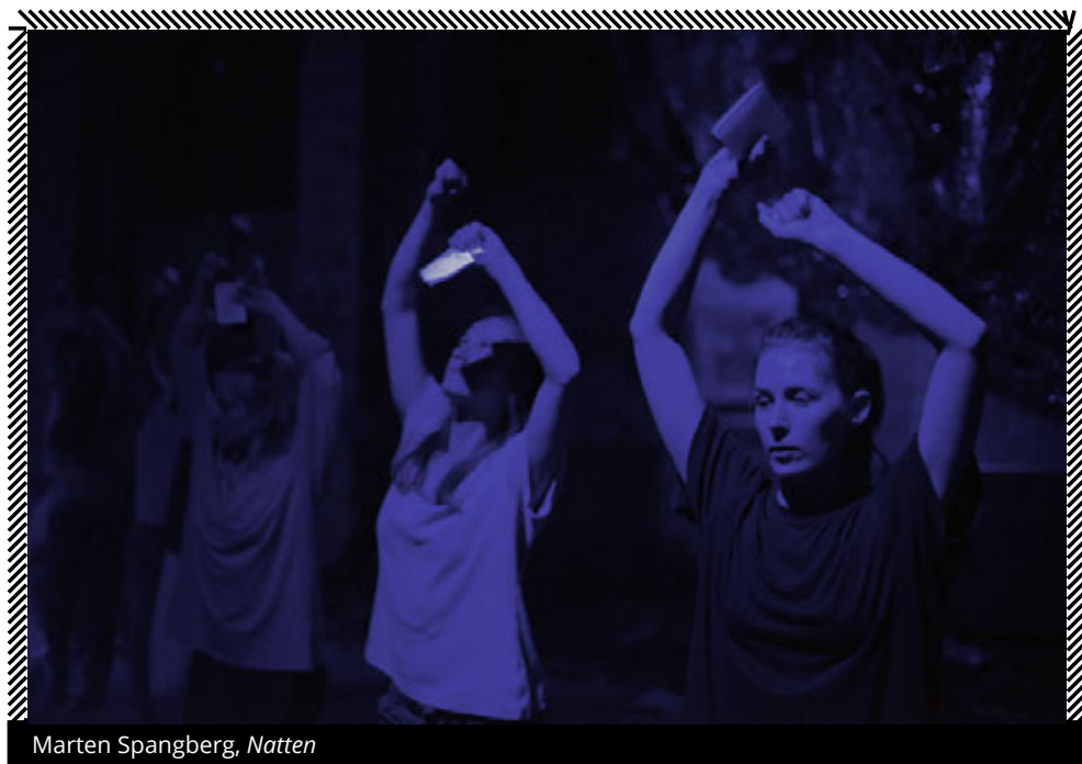
Marten Spangberg, Natten

In entrambi i lavori i performer di Spangberg abitano lo spazio scenico alternando diversi stati di presenza performativa che vengono presentati senza soluzione di continuità: l'esecuzione di precise coreografie, singole o di gruppo, allo stesso tempo mockering e rielaborazione di quelle del mondo dei videoclip R&B, si alterna ad interventi apparentemente estemporanei come cantare, dipingere, truccarsi e a semplici azioni quali bere, mangiare, riposarsi, cambiarsi d'abito. Una sequenza ininterrotta di movimento condiviso e diffuso, che cambia in continuazione in maniera impercettibile, senza rotture o violenti passaggi di stato: per Spangberg coreografia è un concetto che ha a che fare maggiormente con la costruzione di un tempo e uno spazio che con il disegno di una partitura ritmica di movimento.